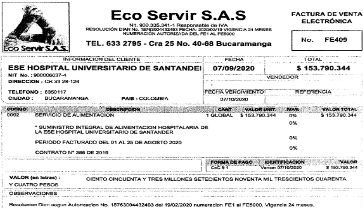
Imagen 2: Primera Factura Eco Servir S.A.S - Servicio De Nutrición mes de agosto Fuente: Nutrición