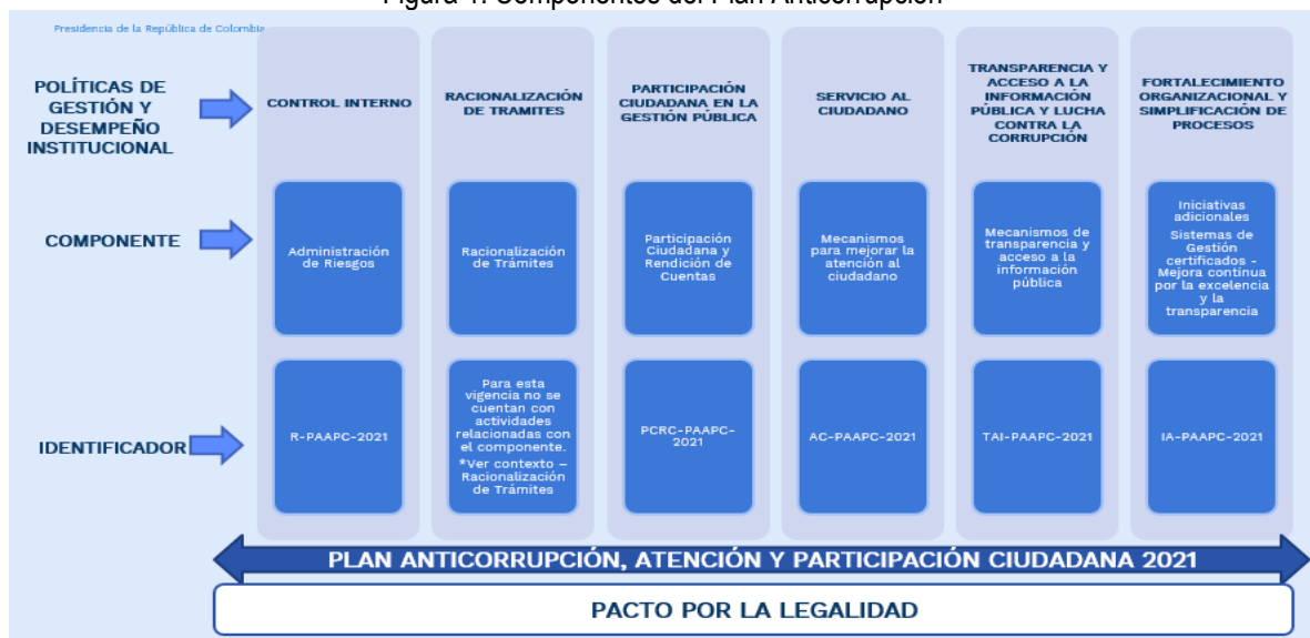
Figura 1. Componentes del Plan Anticorrupción