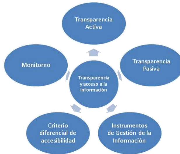
Figura 5. Componentes de la Estrategia de Transparencia y Acceso a la Información